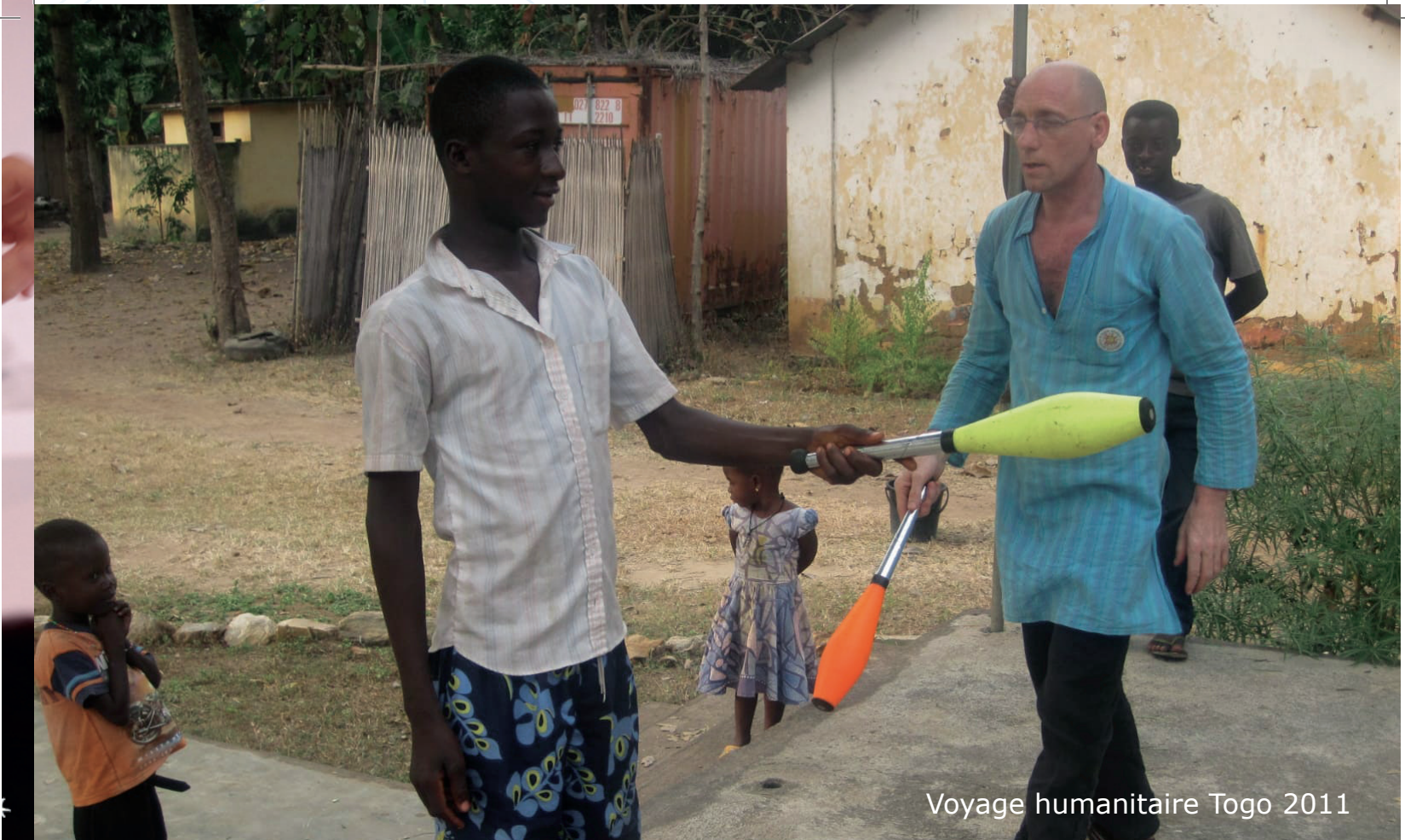
Voyage humanitaire Togo 2011