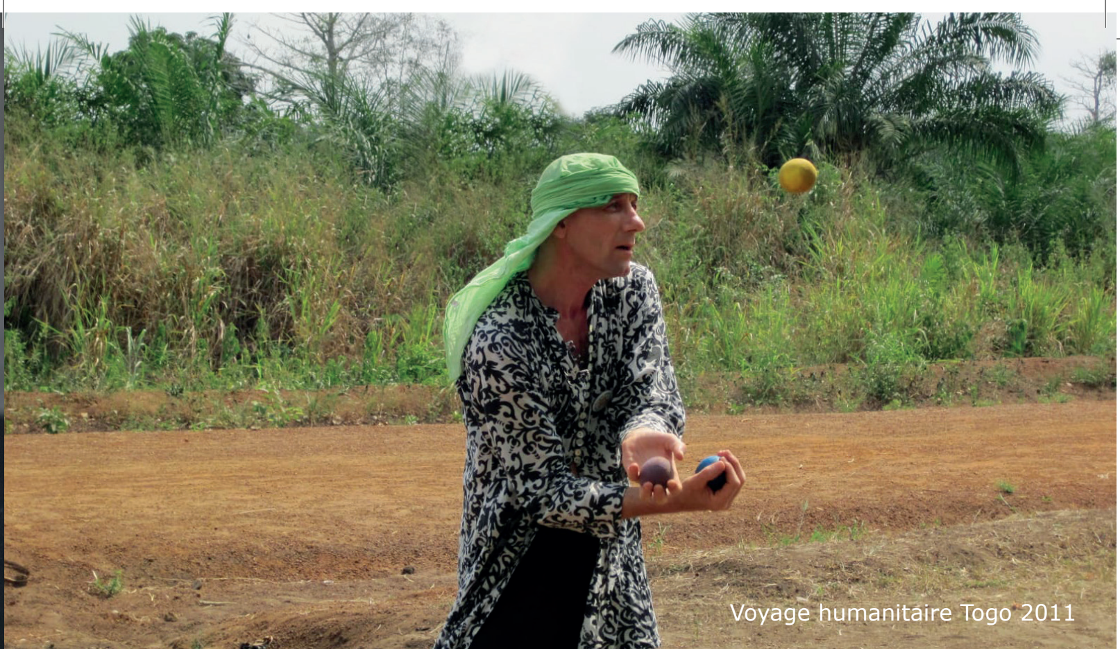
Voyage humanitaire Togo 2011